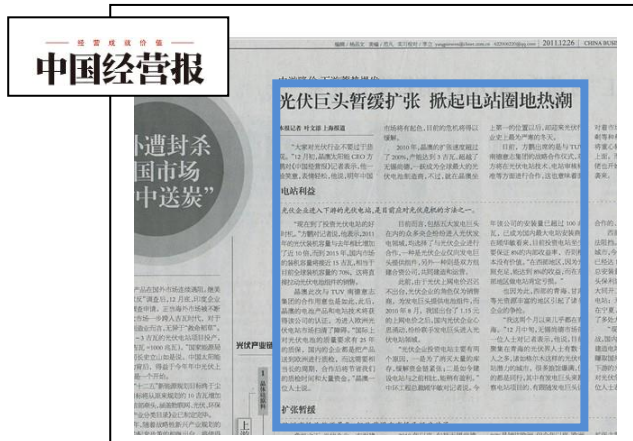
『中国經營報』に転載されたプレスリリース

「100 年以上の歴史を持つドイツに認証された「老舗」として、TÜV SÜD グループは中国での成長を追い求めるほか、長期的な安定と厳格な専門のブランドイメージをより重視しています。市場の需要と供給の変化にともない、認証サービス業界も市場マーケティングと営業専門のチーム設立をより重視するようになってきました。基本的なデータの導入や専門的な市場の調査研究からイベントの企画・実施及びメディアへの露出まで、認証業界の市場での活動はますます専門化しています。ここ数年、PR ニュースワイヤの専門的かつ成熟した配信サービスの利用を通じて TÜV SÜD グループの中国でのメディア露出度は業界トップクラスになりました。」