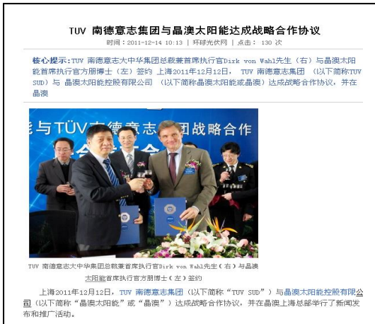
環球光伏網に転載されたプレスリリース