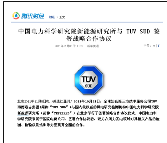
騰訊網に転載されたプレスリリース